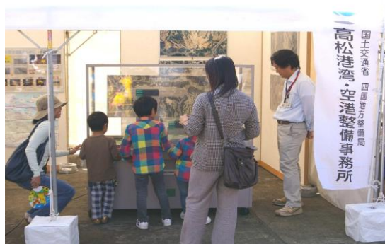
▲空港の構造・断面模型に興味津々

平成二十三年十月十五日、高松空港において「空の日」イベントが開催され、多数の地域の皆様にお越し頂きました。 当事務所は、空港の構造・断面模型やパネルを展示し、山岳丘陵地帯への建設方法等を紹介しました。 また、各会場では空港探検隊や航空パイロット教室をはじめ、お子様がパイロット・キャビンアテンダント・自衛隊員の制服を試着できる「キッズ制服撮影会」等、様々な催し物で大いに盛り上がりました。 これからも高松空港をはじめとした「空の日」を多くの方々に興味を持って頂ければ幸いです。 (企画調整課 中川)