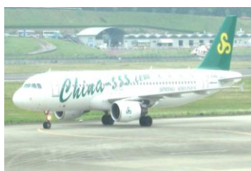
▲高松空港に到着した春秋航空機

二〇一〇年十月十八日の定例記者会見で浜田恵造香川県知事は、県が同年三月に中国と台湾の三航空会社に対して高松空港への定期路線開設を要望したところ、中国の格安航